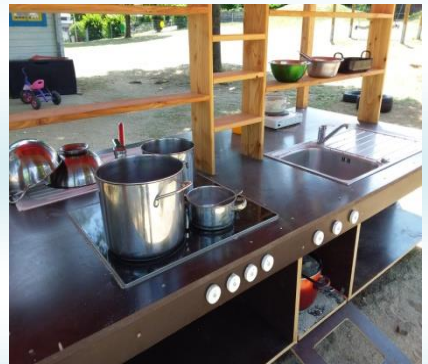
Neue Kinderküche im Freien

Nach der offiziellen Einweihung ging es zum gemütlichen Teil über. Es gab verschiedenes Gegrilltes und am Nachmittag Kaffee und Kuchen. Für die Kinder wurden unterschiedliche Spielstationen aufgebaut, die den Kindern trotz sehr sommerlicher Temperaturen viel Spaß machten. Zum Abschluss unterhielten der Trachtenverein und die „ Zumba Kids “ des Sportvereins das Publikum bestens mit ihren Tänzen.