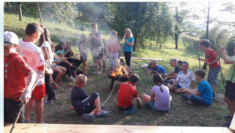
Lagerfeuerabend mit Mutprobe